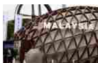
Expo 2015: le celebrazioni del National Day della Malesia