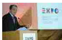
Expo 2015: convegno Expo Chiama Africa