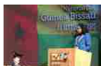
La Repubblica di Guinea ha celebrato il National Day a Expo 2015